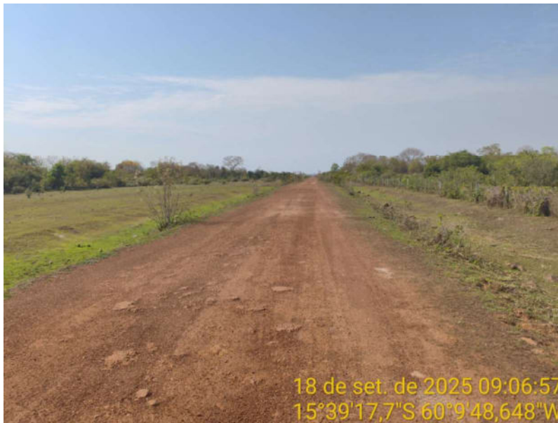
Foto 44 – Trecho não pavimentado de Vila Bela sentido Dest. Militar de São Simão.