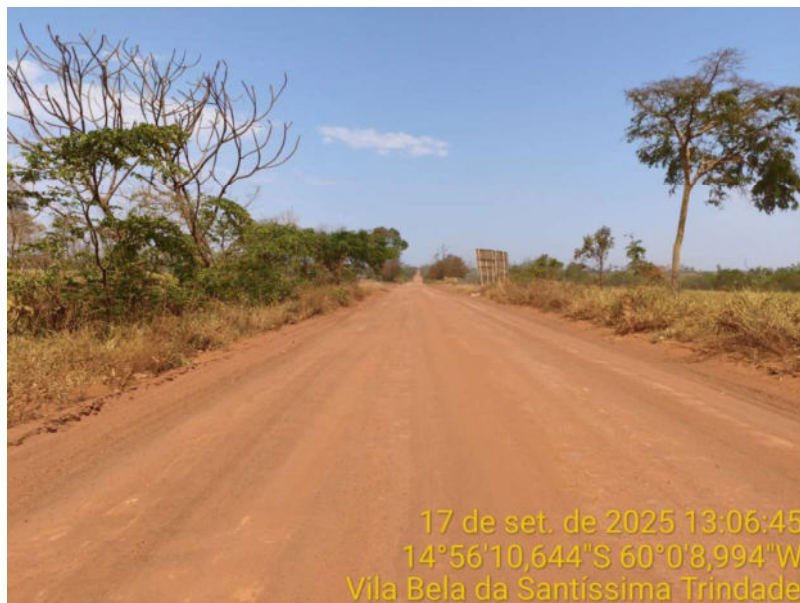
Foto 03 - Trecho não pavimentado de Vila Bela sentido divisa com Comodoro-MT.