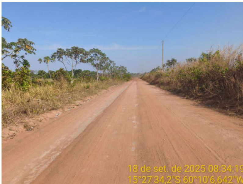
Foto 39 – Trecho não pavimentado de Vila Bela sentido Dest. Militar de São Simão.