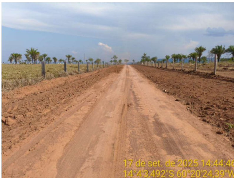
Foto 24 - Trecho não pavimentado de Vila Bela sentido divisa com Comodoro-MT.