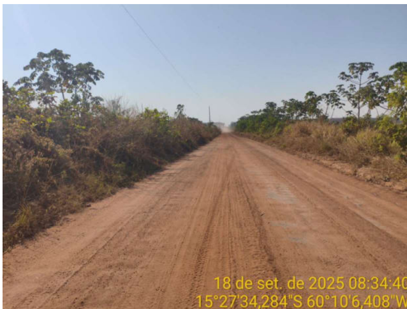
Foto 40 – Trecho não pavimentado de Vila Bela sentido Dest. Militar de São Simão.