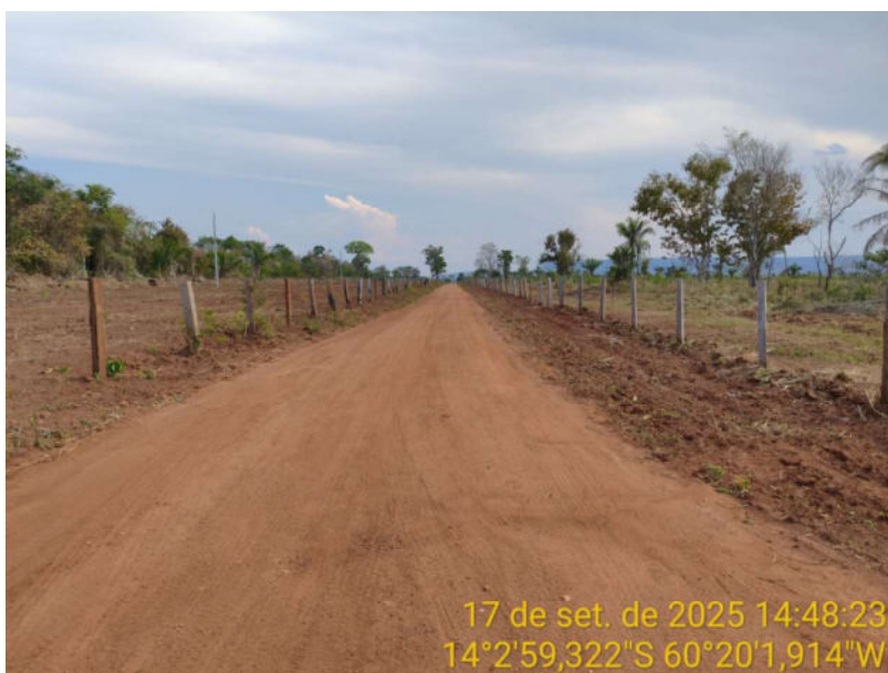
Foto 26 - Trecho não pavimentado de Vila Bela sentido divisa com Comodoro-MT.