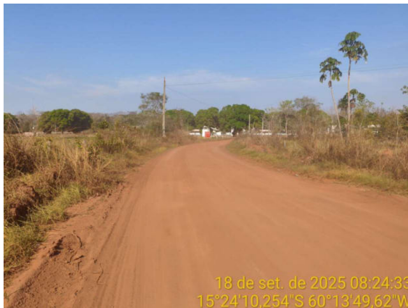
Foto 38 – Trecho não pavimentado de Vila Bela sentido Dest. Militar de São Simão.