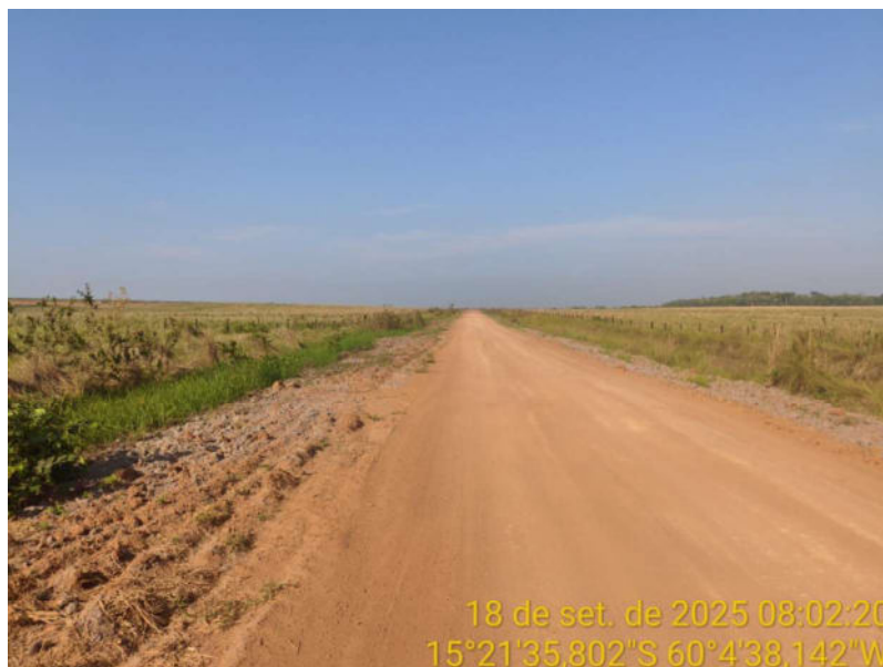
Foto 34 – Trecho não pavimentado de Vila Bela sentido Dest. Militar de São Simão.