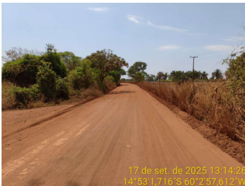
Foto 06 - Trecho não pavimentado de Vila Bela sentido divisa com Comodoro-MT.