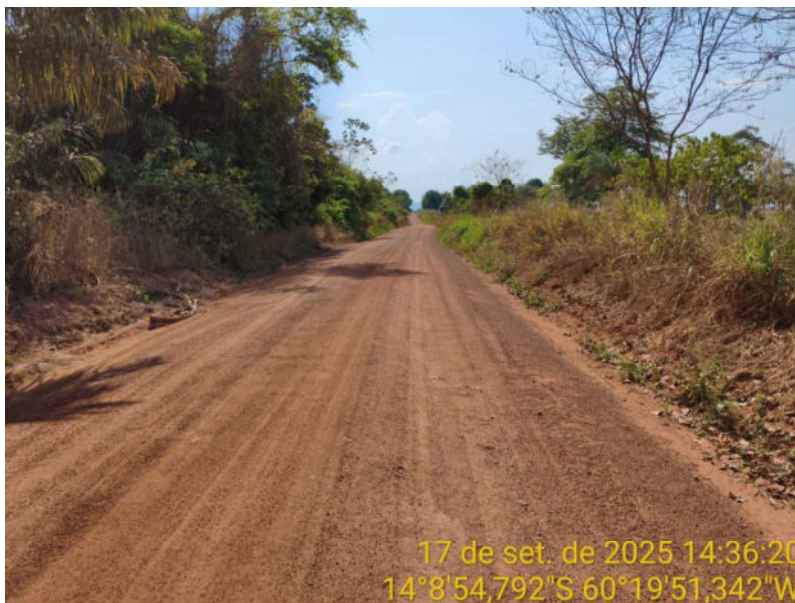
Foto 23 - Trecho não pavimentado de Vila Bela sentido divisa com Comodoro-MT.