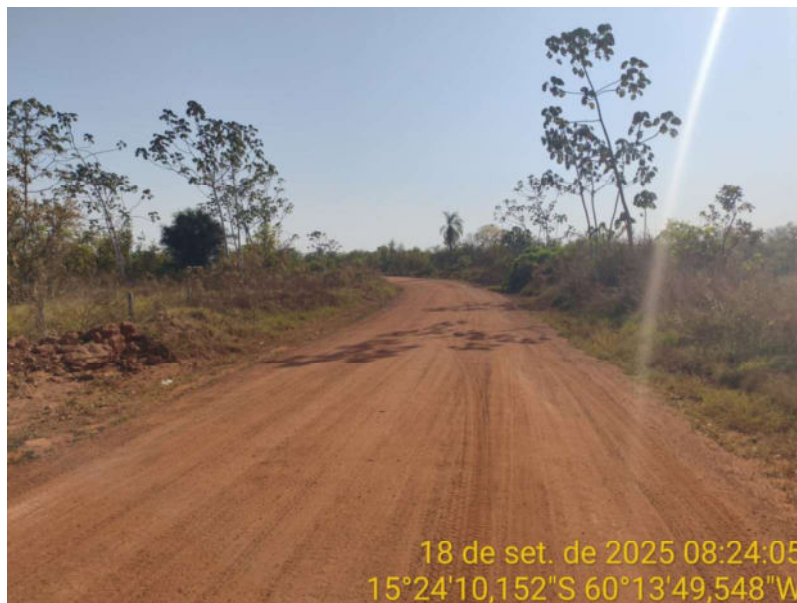
Foto 37 – Trecho não pavimentado de Vila Bela sentido Dest. Militar de São Simão.