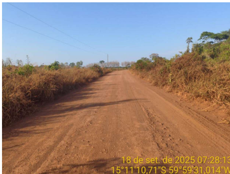
Foto 32 – Trecho não pavimentado de Vila Bela sentido Dest. Militar de São Simão.