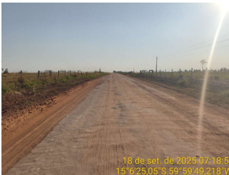
Foto 30 – Trecho não pavimentado de Vila Bela sentido Dest. Militar de São Simão.