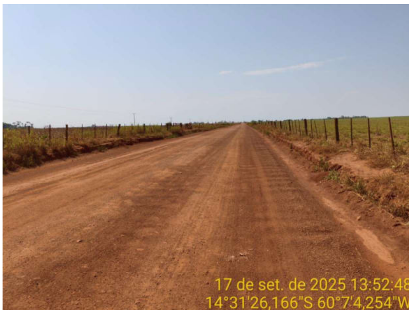
Foto 14 - Trecho não pavimentado de Vila Bela sentido divisa com Comodoro-MT.