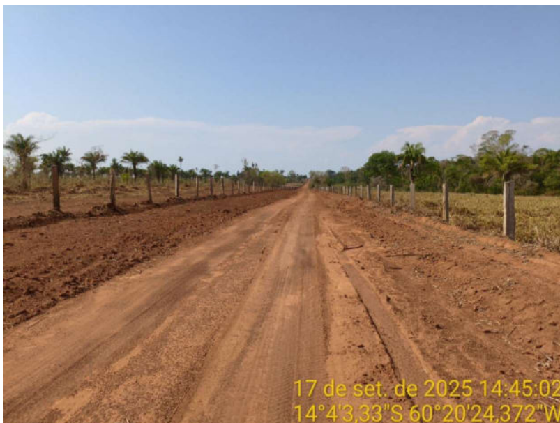
Foto 25 - Trecho não pavimentado de Vila Bela sentido divisa com Comodoro-MT.