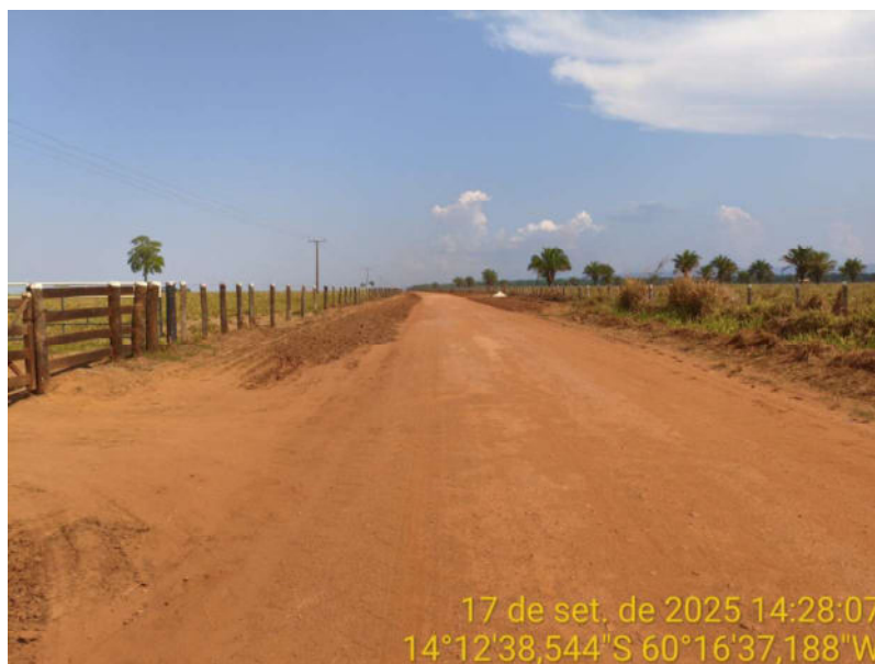
Foto 22 - Trecho não pavimentado de Vila Bela sentido divisa com Comodoro-MT.