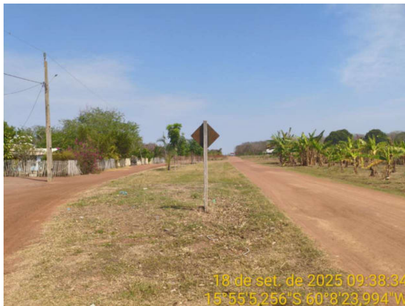
Foto 49 – Fim do trecho não pavimentado de Vila Bela sentido Dest. Militar de São Simão.