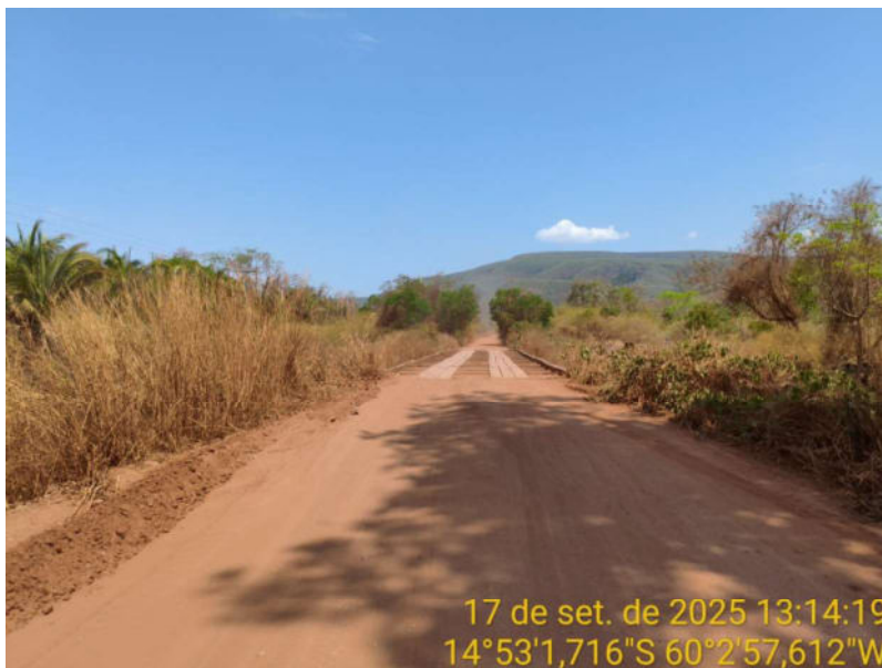
Foto 05 - Trecho não pavimentado de Vila Bela sentido divisa com Comodoro-MT.