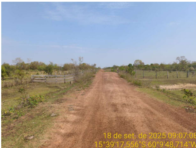
Foto 45 – Trecho não pavimentado de Vila Bela sentido Dest. Militar de São Simão.