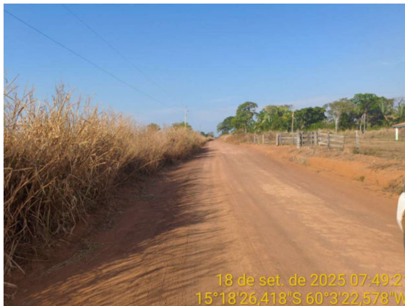
Foto 33 – Trecho não pavimentado de Vila Bela sentido Dest. Militar de São Simão.