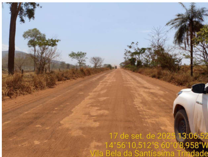
Foto 04 - Trecho não pavimentado de Vila Bela sentido divisa com Comodoro-MT.