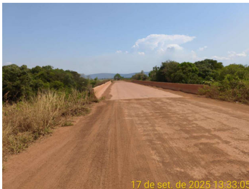
Foto 10 - Trecho não pavimentado de Vila Bela sentido divisa com Comodoro-MT.