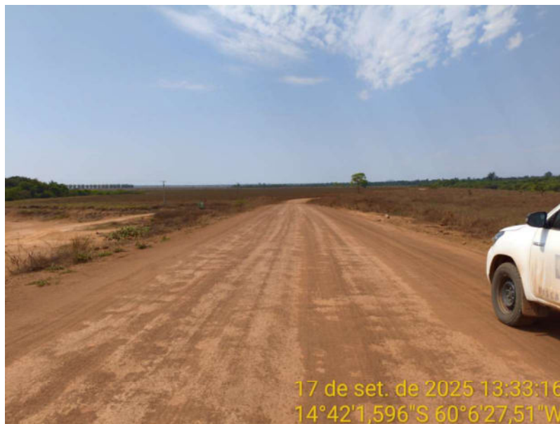
Foto 11 - Trecho não pavimentado de Vila Bela sentido divisa com Comodoro-MT.