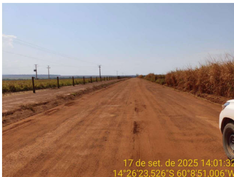
Foto 16 - Trecho não pavimentado de Vila Bela sentido divisa com Comodoro-MT.