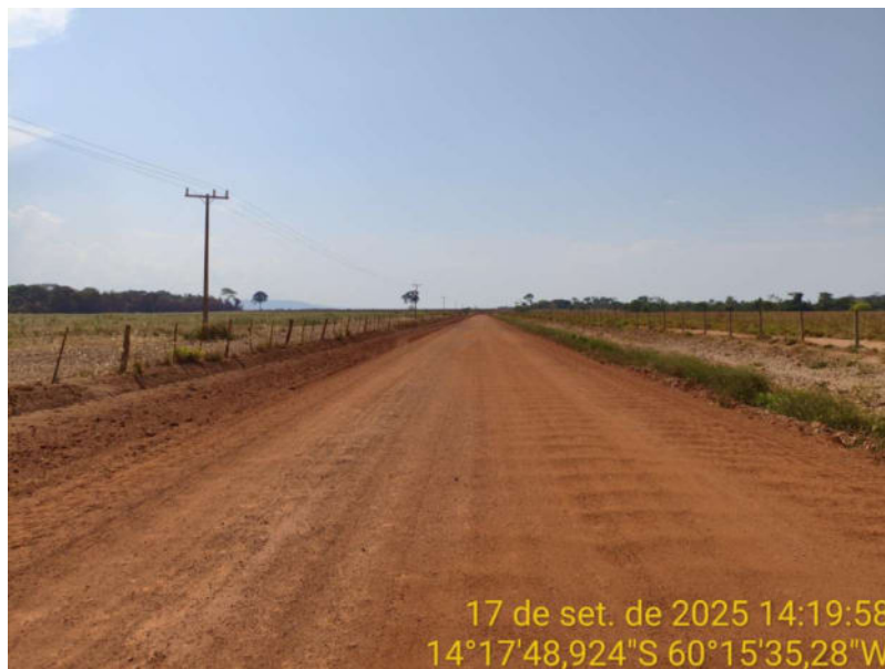
Foto 20 - Trecho não pavimentado de Vila Bela sentido divisa com Comodoro-MT.