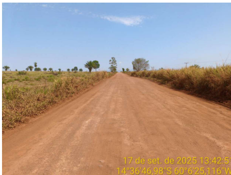
Foto 12 - Trecho não pavimentado de Vila Bela sentido divisa com Comodoro-MT.