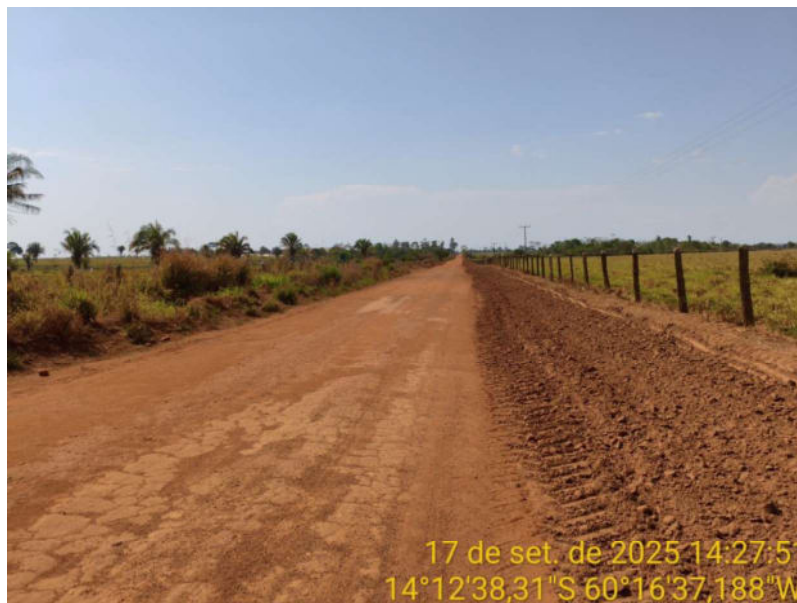
Foto 21 - Trecho não pavimentado de Vila Bela sentido divisa com Comodoro-MT.