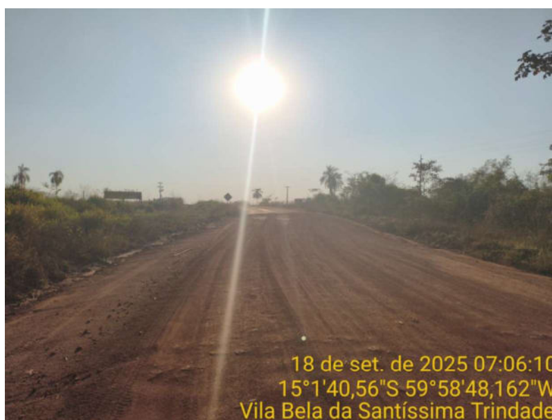
Foto 28 – Trecho não pavimentado de Vila Bela sentido Dest. Militar de São Simão.