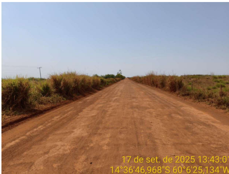
Foto 13 - Trecho não pavimentado de Vila Bela sentido divisa com Comodoro-MT.