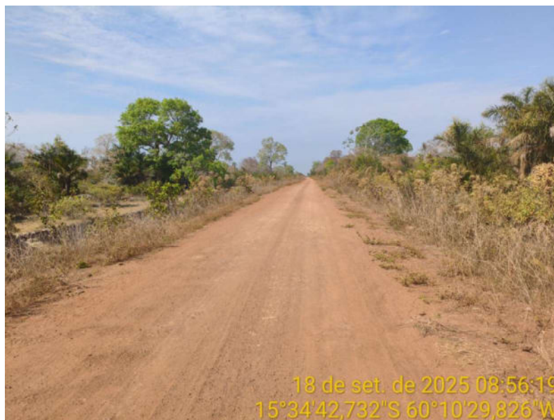
Foto 42 – Trecho não pavimentado de Vila Bela sentido Dest. Militar de São Simão.