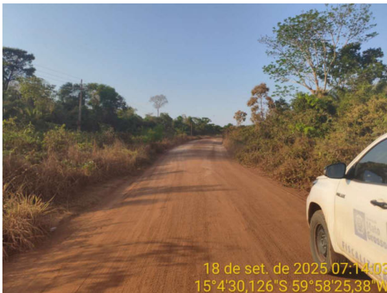
Foto 29 – Trecho não pavimentado de Vila Bela sentido Dest. Militar de São Simão.