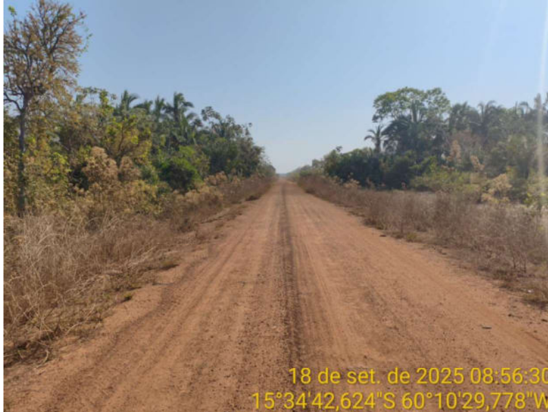
Foto 43 – Trecho não pavimentado de Vila Bela sentido Dest. Militar de São Simão.