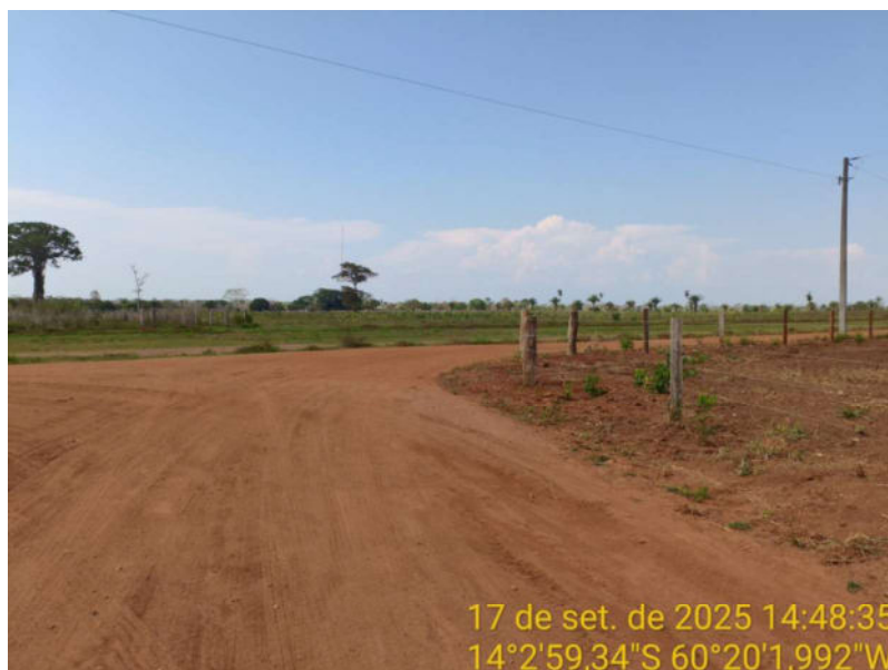
Foto 27 – Fim do trecho não pavimentado de Vila Bela sentido divisa com Comodoro-MT.