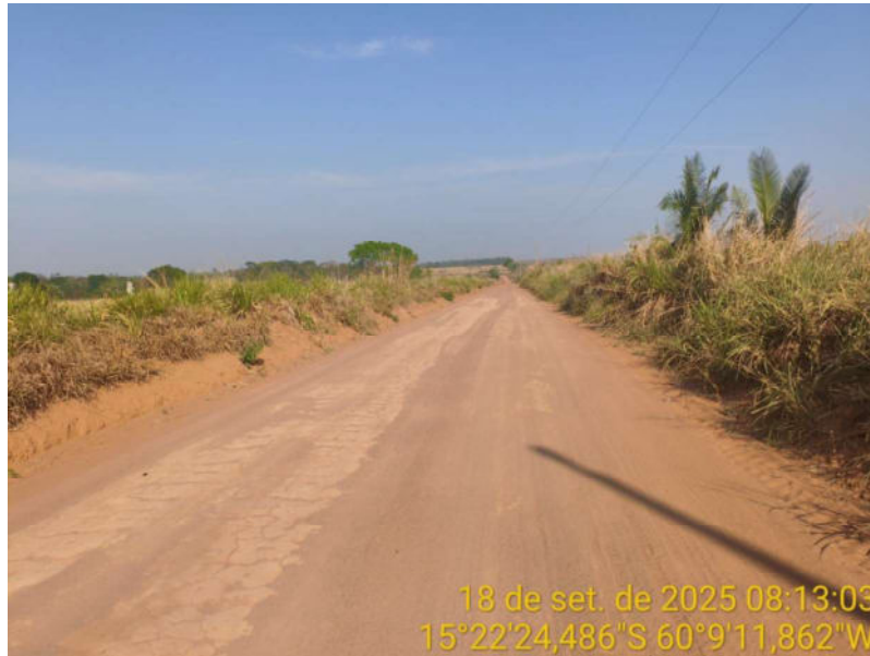
Foto 36 – Trecho não pavimentado de Vila Bela sentido Dest. Militar de São Simão.