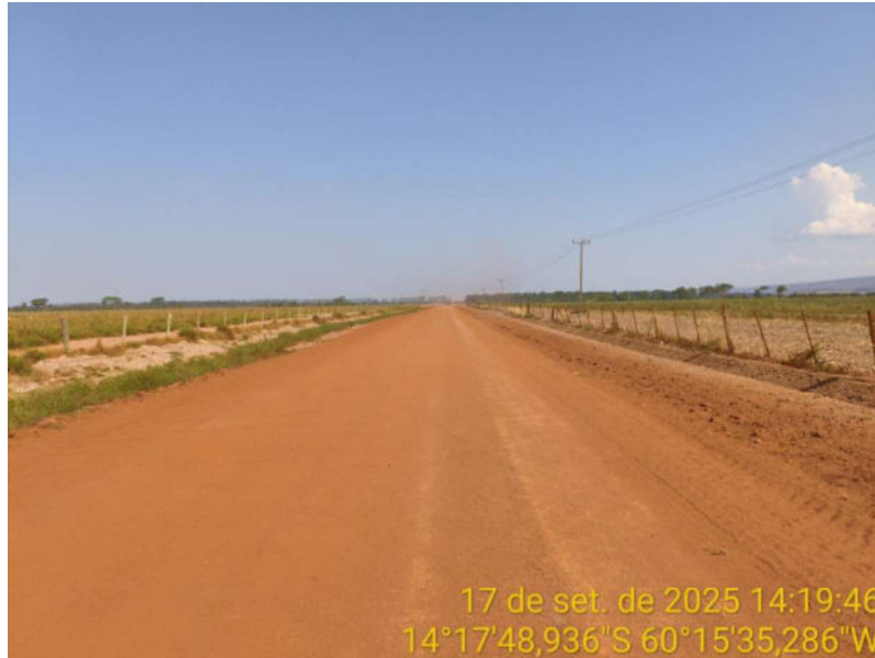
Foto 19 - Trecho não pavimentado de Vila Bela sentido divisa com Comodoro-MT.