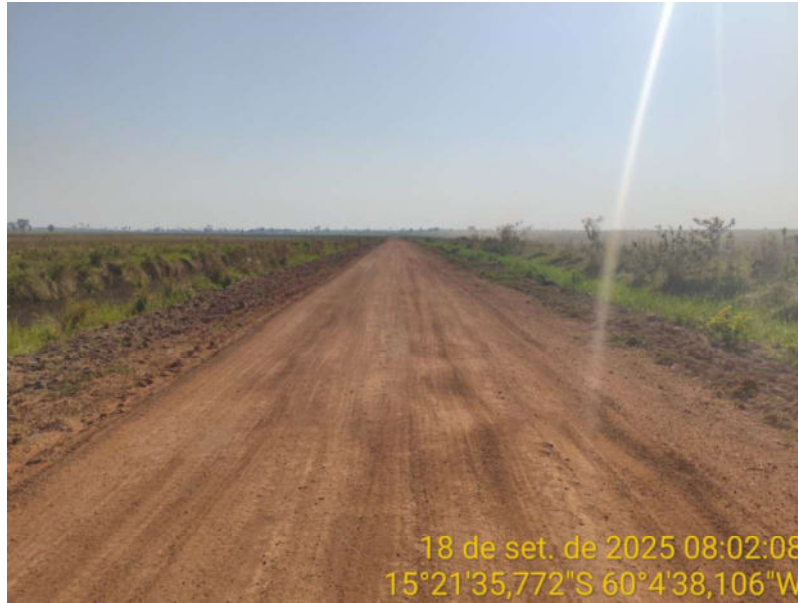
Foto 35 – Trecho não pavimentado de Vila Bela sentido Dest. Militar de São Simão.