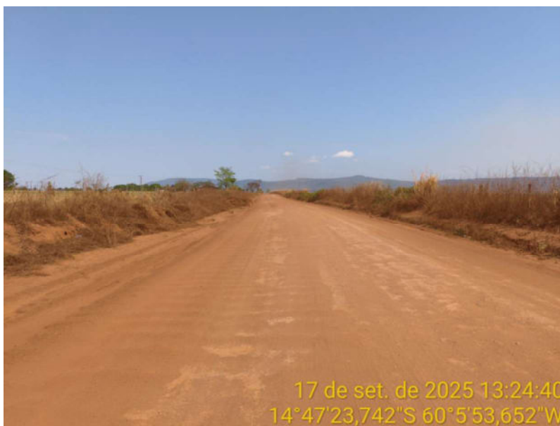
Foto 08 - Trecho não pavimentado de Vila Bela sentido divisa com Comodoro-MT.