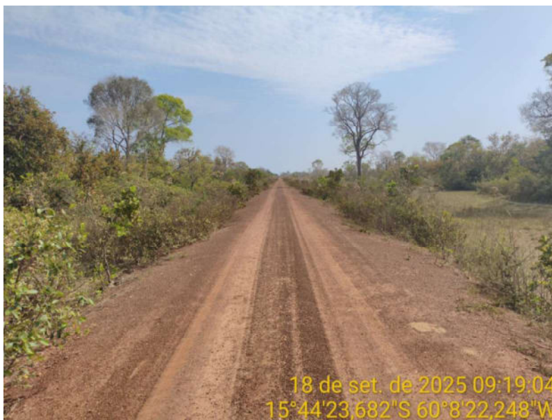
Foto 46 – Trecho não pavimentado de Vila Bela sentido Dest. Militar de São Simão.