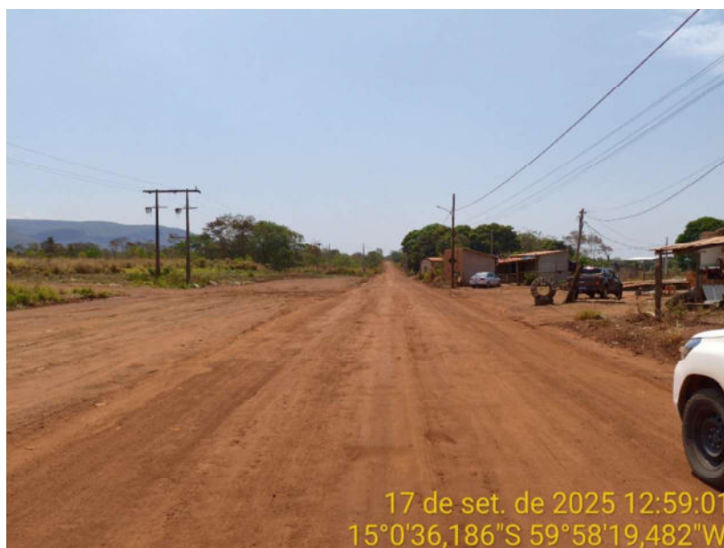
Foto 02 - Início do trecho não pavimentada de Vila Bela sentido divisa com Comodoro-MT.