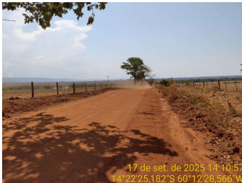
Foto 18 - Trecho não pavimentado de Vila Bela sentido divisa com Comodoro-MT.