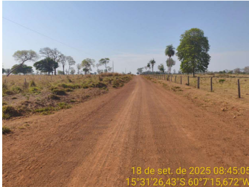
Foto 41 – Trecho não pavimentado de Vila Bela sentido Dest. Militar de São Simão.