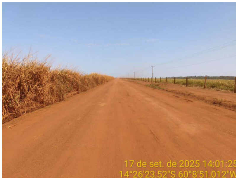
Foto 15 - Trecho não pavimentado de Vila Bela sentido divisa com Comodoro-MT.