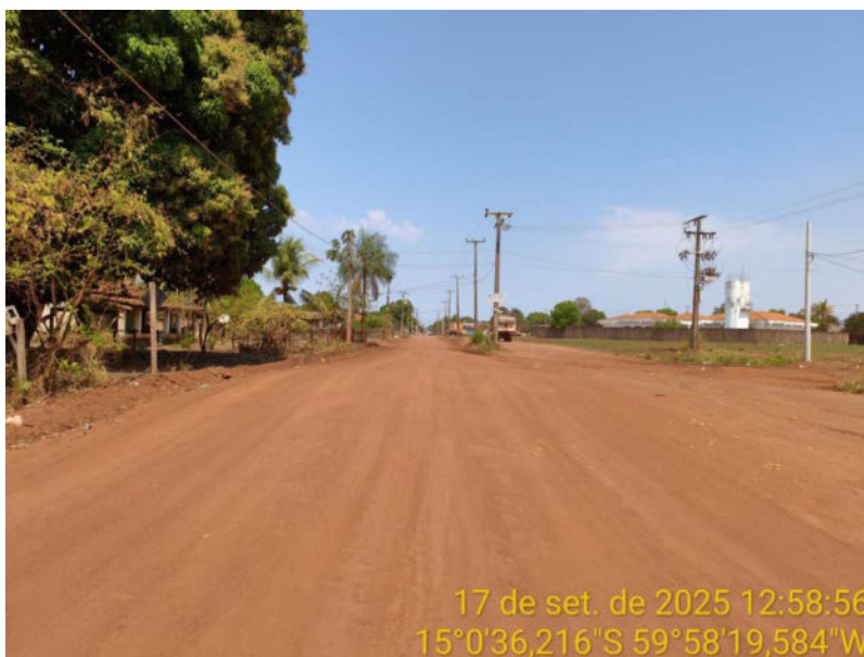
Foto 01 - Início do trecho não pavimentada de Vila Bela sentido divisa com Comodoro-MT.