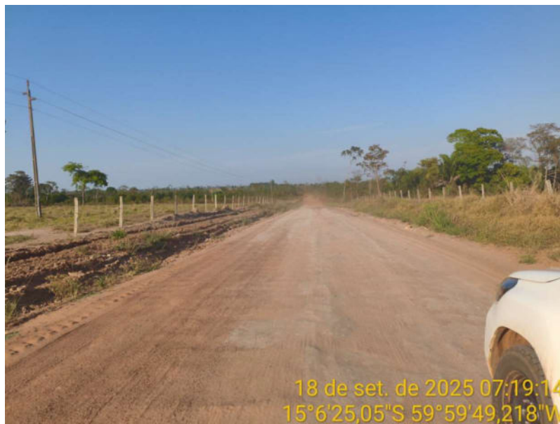
Foto 31 – Trecho não pavimentado de Vila Bela sentido Dest. Militar de São Simão.