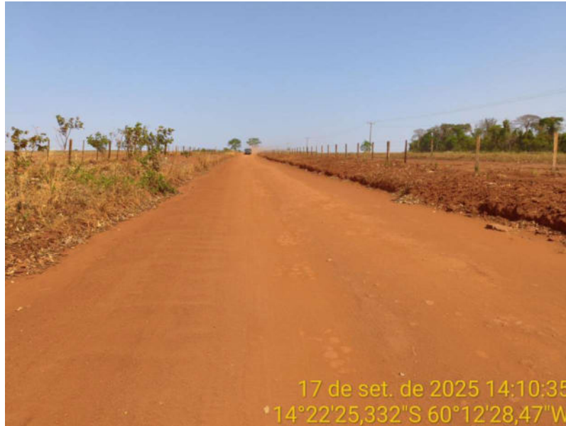
Foto 17 - Trecho não pavimentado de Vila Bela sentido divisa com Comodoro-MT.