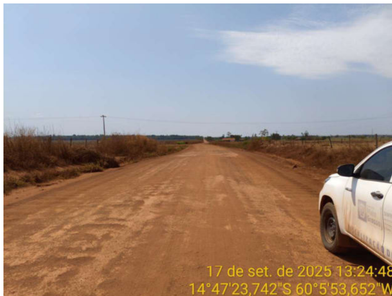
Foto 09 - Trecho não pavimentado de Vila Bela sentido divisa com Comodoro-MT.